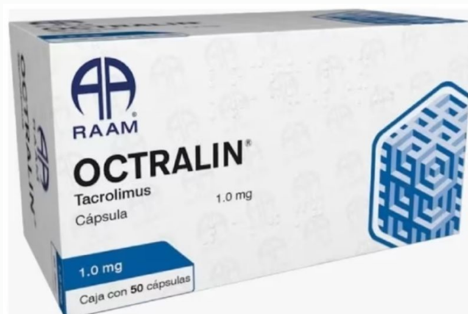
Tabla 2. Motivo de restriccion de uso del producto OCTRALIN (Tacrolimus) de 1.0mg y 5 mg.