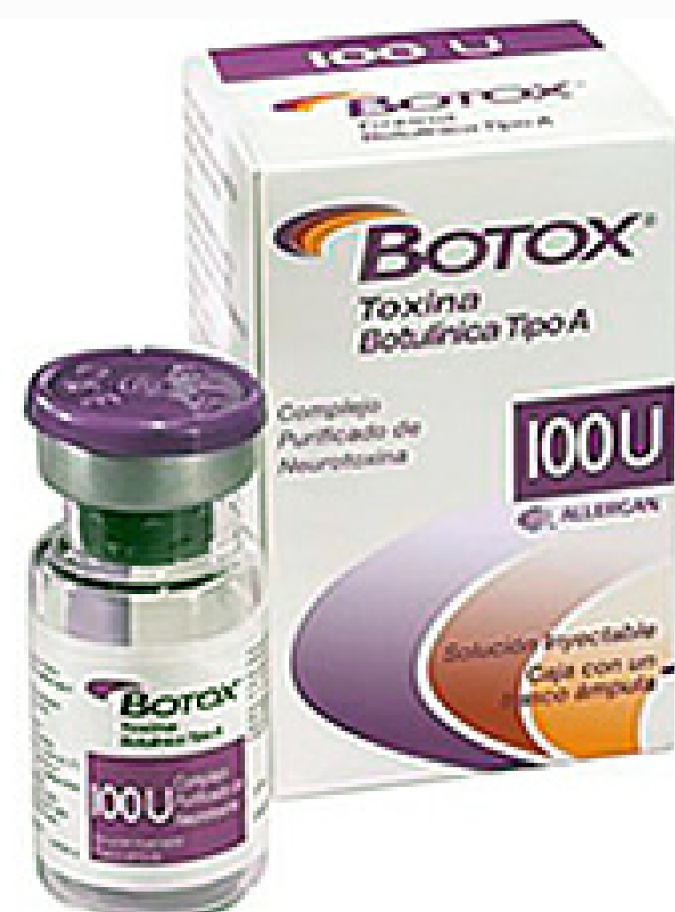
Tabla 1. Lotes y caducidades con falsificación identificada deL BOTOX (Toxina Butilinica Tipo A) 100U.